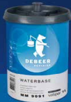
WaterBase Serie 900+